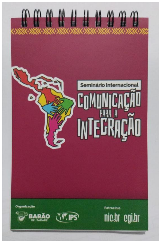
Bloco de notas